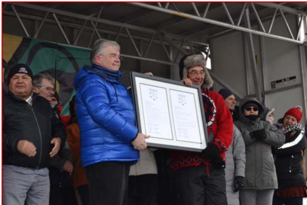
Remise de la Déclaration endossée par la ville le 15 décembre 2015.