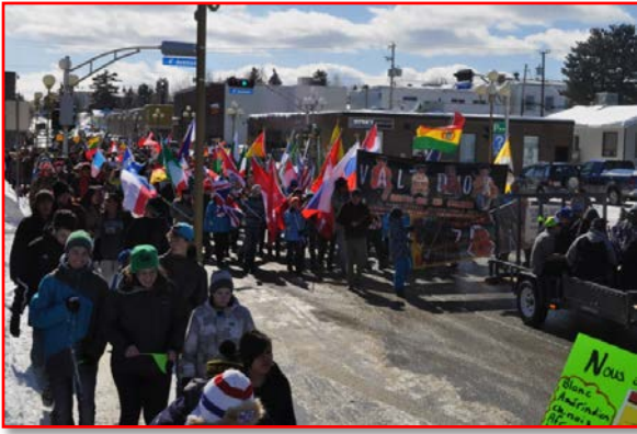
2014 : 1 800 marcheurs lors de la Marche Gabriel-Commanda, année record.