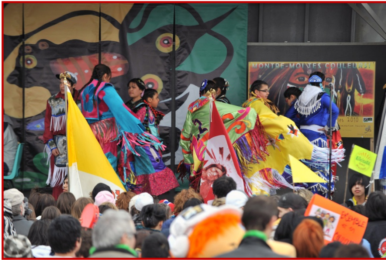
Ouverture traditionnelle avec les tambours Screaming Eagle et les danseurs du Lac Simon.