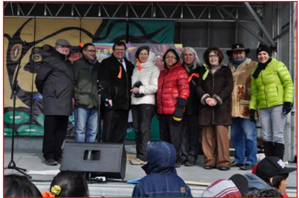
Vendredi 20 mars 2015, 1 500 marcheurs lors de la Marche Gabriel-Commanda